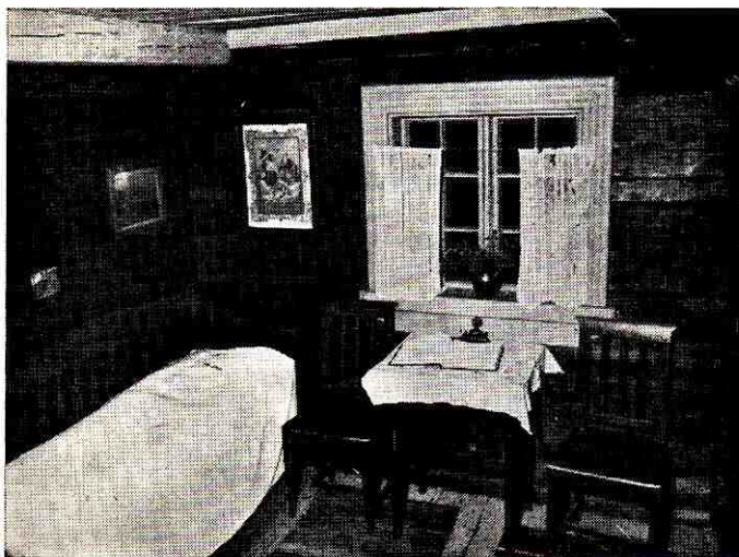
Aleksis Kiven huone — Aleksis Kivis rum — Das Zimmer von Aleksis Kivi — Aleksis Kivi's room