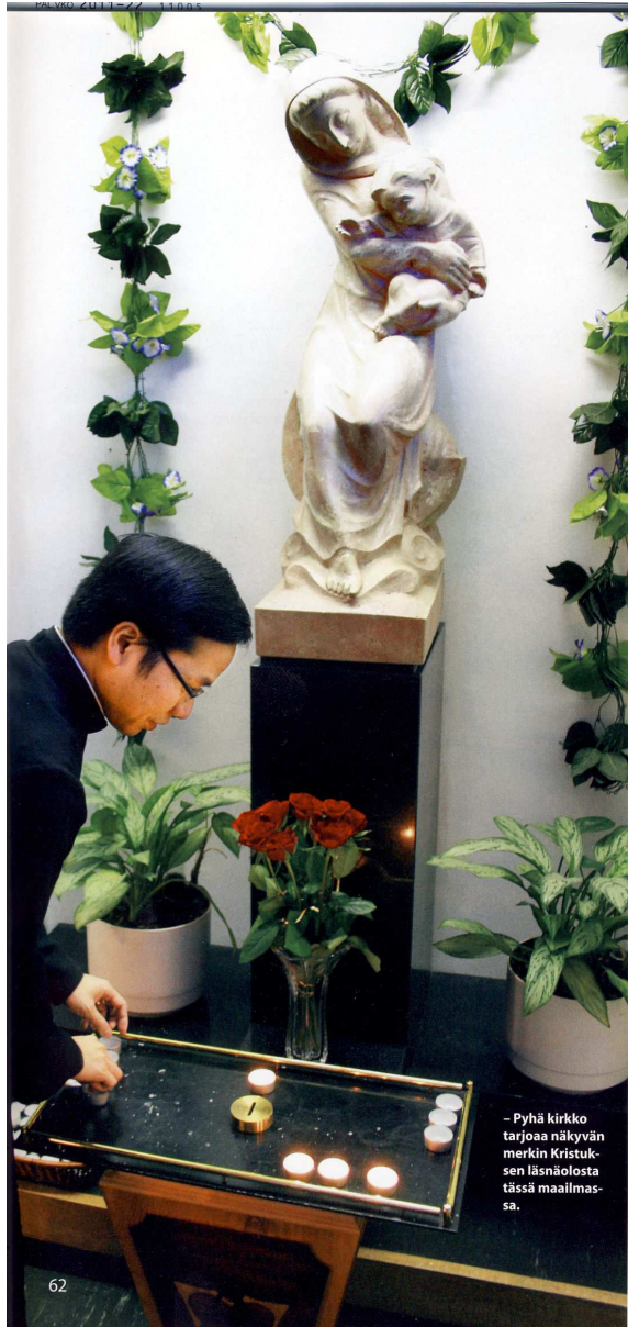
– Pyhä kirkko tarjoo näkyvän merkin Kristuksen läsnäolosta tässä maailmassa.