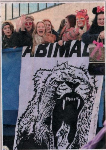
Me ollaan eläimiä kaikki...