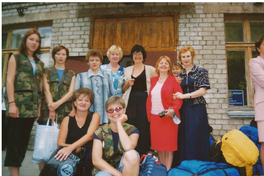
On lähdön aika! KIITOS