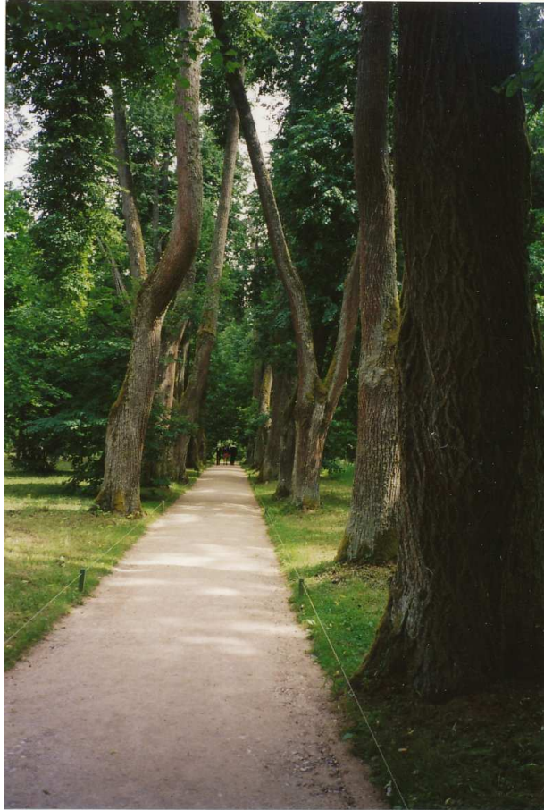
Puskinin ja Anna Kareninan puistokuja