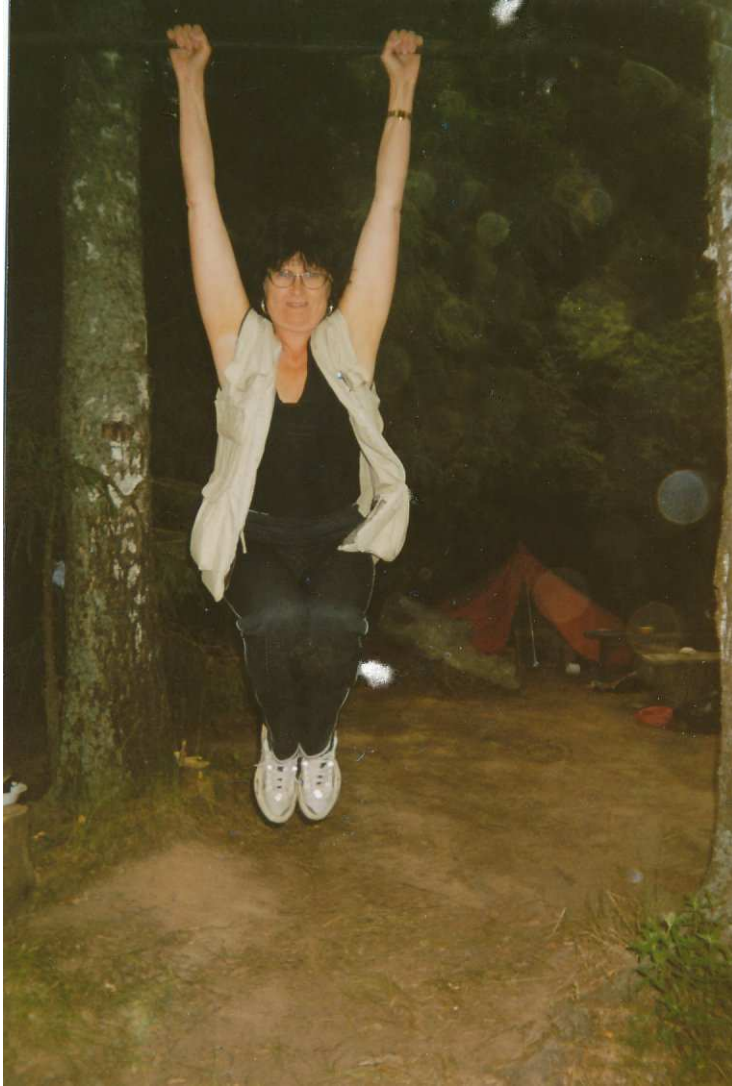
Iltavoimistelu ennen teltaan kömpimistä