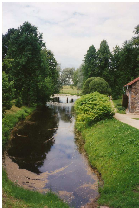
“Ja otsin ljubjuu tibjaa, Puskin” (“Minä rakastan Sinua ,Pushkin”)