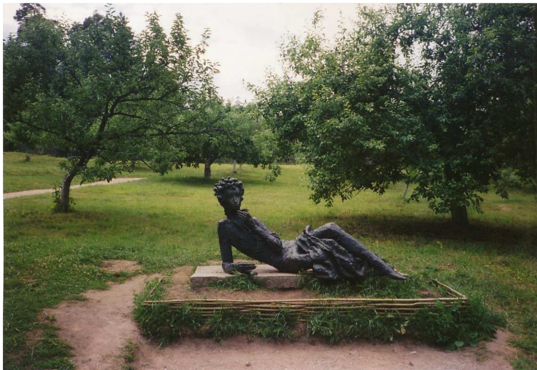
Aleksandr Sergejevič Puškin 1799-1837