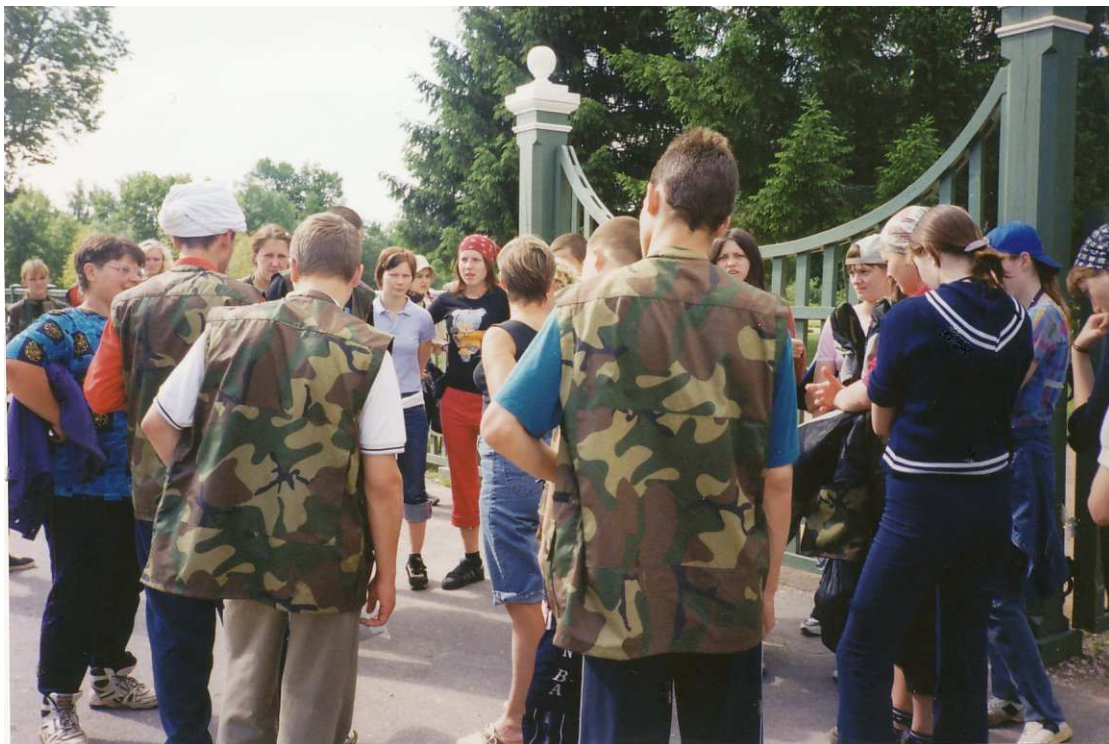
Vierailu Puskinin pojan Grigory Puskinin huvilalla